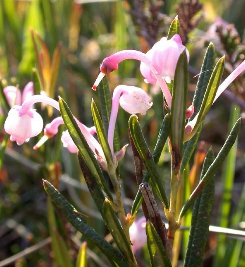
Rosmarinheide (grünes handwerk - H. Kammerer)