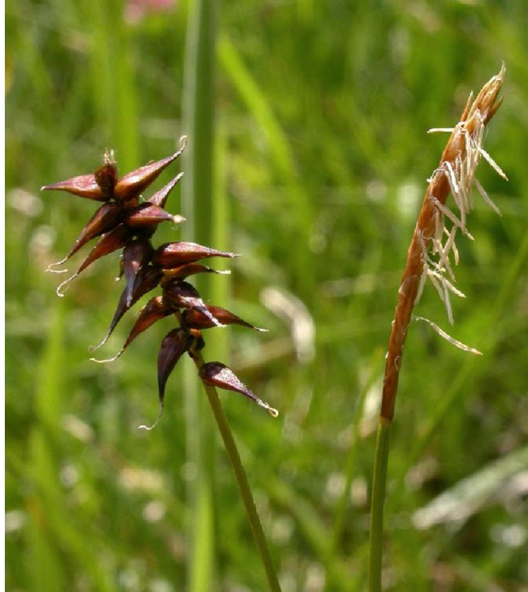
Davall-Segge (grünes handwerk - H. Kammerer)