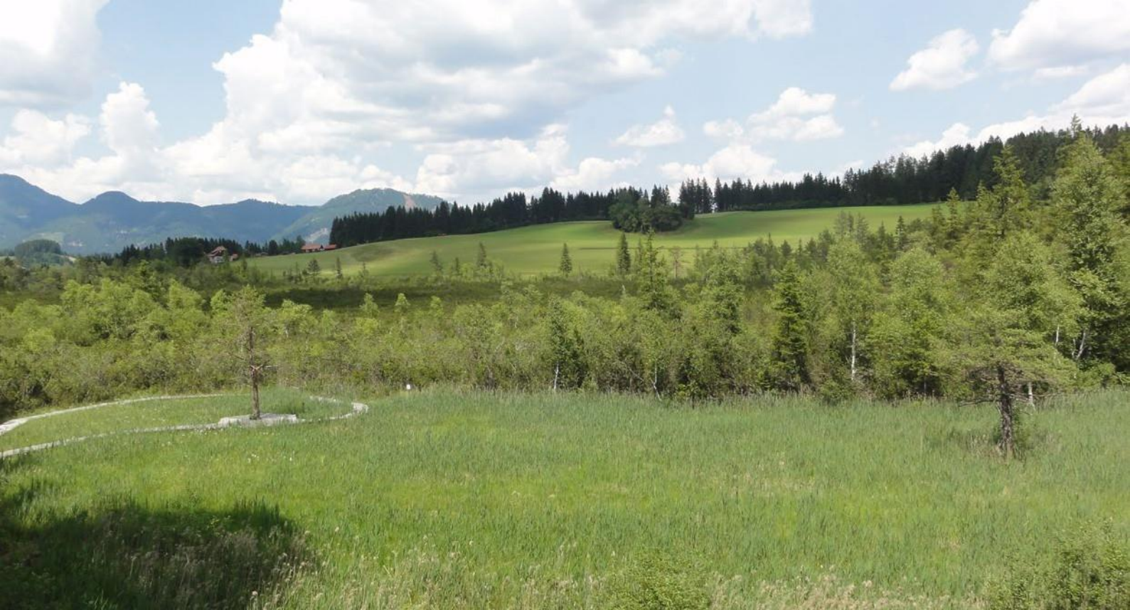
Dürnberger Moor